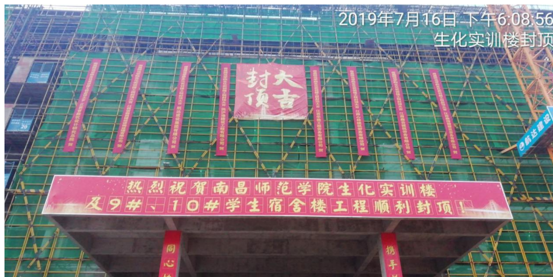
7月16日 生化实训楼封顶大吉