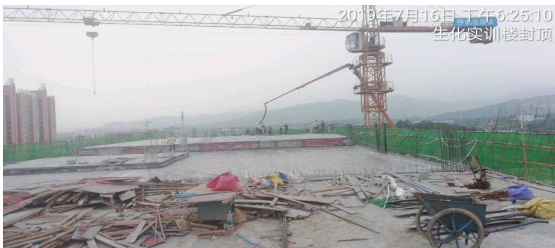
7月16日 生化实训楼封顶施工。