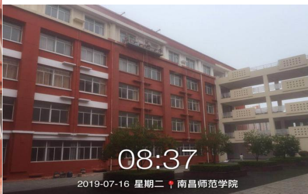
外墙改造一期，抢抓天气进行扫尾工作